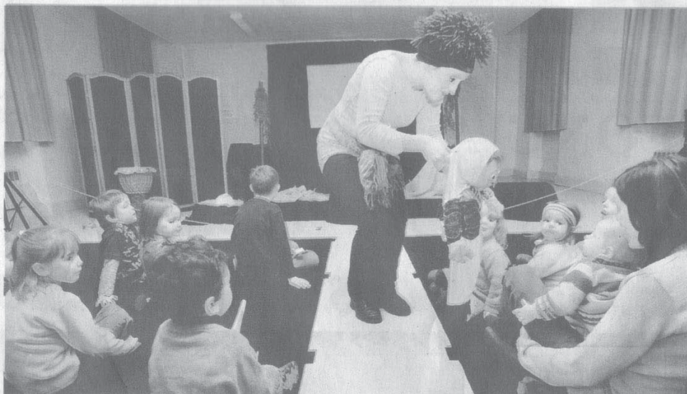
Tendre, poétique, mimé, un spectacle de grande fraîcheur hier au centre culturel.

Joli rendez-vous donné hier en fin d'après-midi pour les petits. La compagnie Virtuelle les a embarqués dans un voyage poétique et sensoriel, où les marionnettes tour à tour se transforment en animaux de la jungle. Un spectacle qui plus est coloré par des musiques englobant tous les genres. Djembé, classique, jazz, que de bonheur à voir tous ces animaux dans un univers sans parole, mais terriblement parlant. La naissance d'une autruche donne lieu ici à un indescriptible enchantement. Les enfants suivent ce bal animé avec beaucoup de plaisir. Belle rencontre avec une compagnie qui affichait le plein, salle Picasso. Il nous tarde de les revoir.