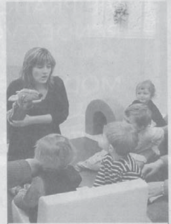
Les enfants aiment le loup rockeur

À LAVARDAC, matinées d'éveil mercredi et vendredi de 9 heures à 12 heures, accueil administratif le mardi après-midi de 13 h 30 à 17 h 30.